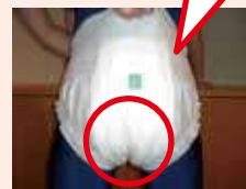
はいた後に引き上げた状態