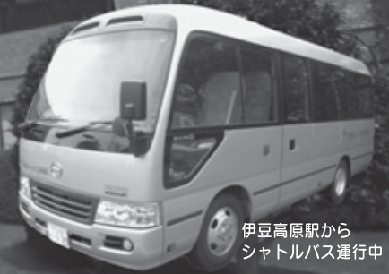
伊豆高原駅から シャトルバス運行中

入湯税150円(6歳以上)、年末年始料金は別途設定有、詳しくはお問合わせください 共用部と客室和洋室(3室)は、バリアフリー対応となります