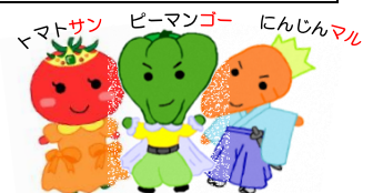
中央区食育野菜キャラクター

*中央区食育野菜キャラクターは、毎日350g以上の野菜を食べることを呼びかけて、区民の健康づくりを応援するキャラクターです。