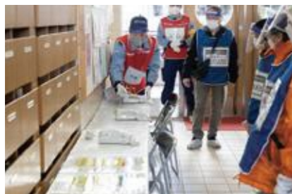
【特設公衆電話の設置】