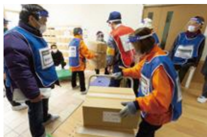
【救援物資の受け入れ】