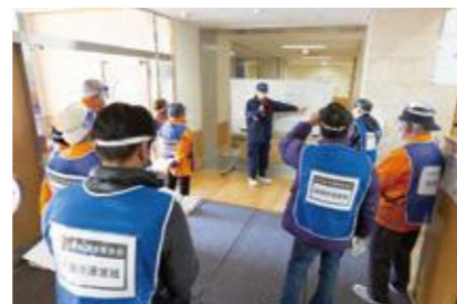
【被害状況などの情報掲示】