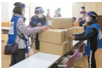
【救援物資の仕分け】