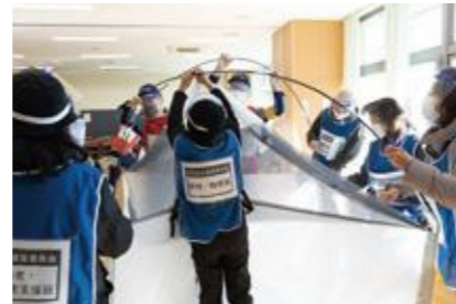
【感染者等専用居室の設営】