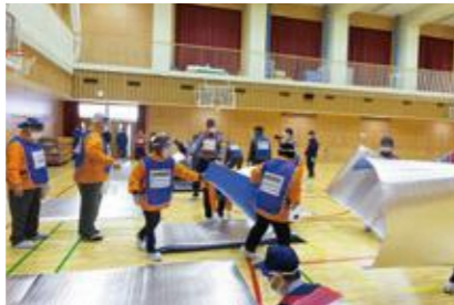
【一般避難居室の設営】