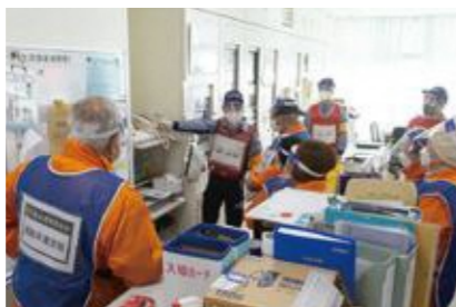
【地域防災無線の確認】