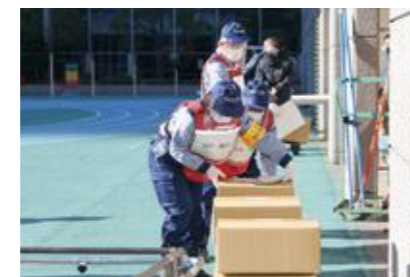
【救援物資の仕分け・管理】