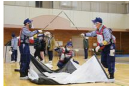
【体調不良者等専用居室の設営】