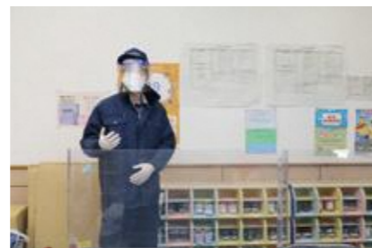
【被害状況などの情報掲示】