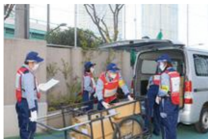
【救援物資の受け入れ】