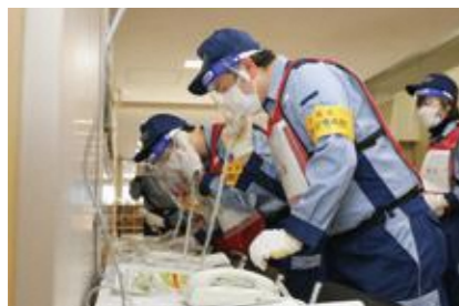
【特設公衆電話の設置】