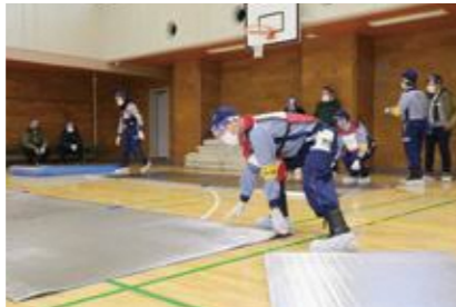
【一般避難居室の設営】