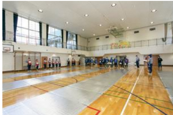
【一般避難居室の設営】