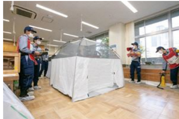
【感染者等専用居室の設営】