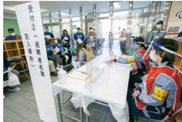
【避難者名簿の記入】