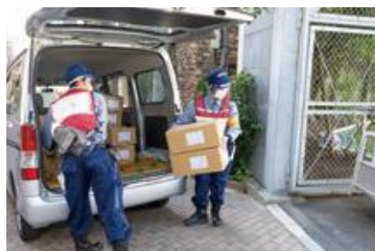
【救援物資の受け入れ】