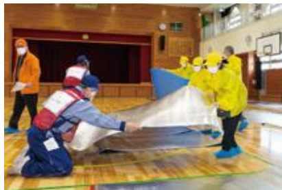
【一般避難居室の設営】