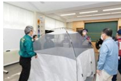
【要配慮者優先居室の設営】