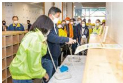
【特設公衆電話の設置】