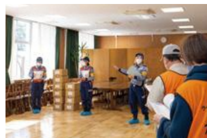
【救援物資の仕分け】