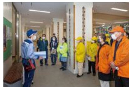
【被害状況などの情報掲示】