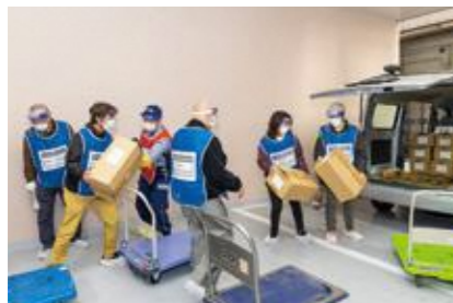
【救援物資の受け入れ】