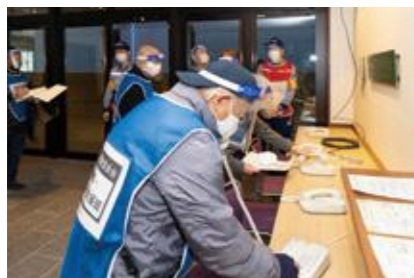
【特設公衆電話の設置】