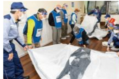
【感染者等専用居室の設営】