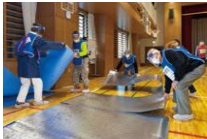
【一般避難居室の設営】