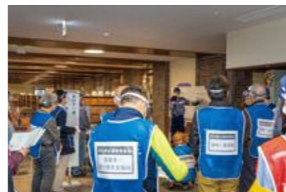
【被害状況などの情報掲示】