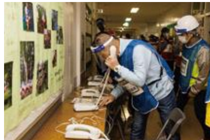
【特設公衆電話の設置】