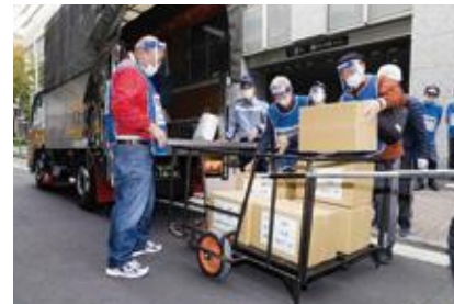
【救援物資受け入れ】