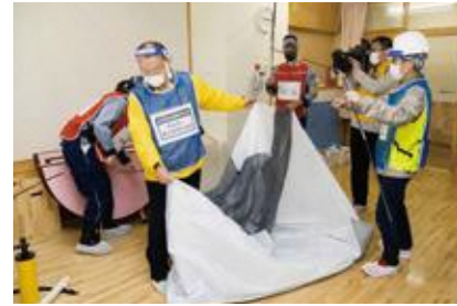
【要配慮者優先居室の設営】