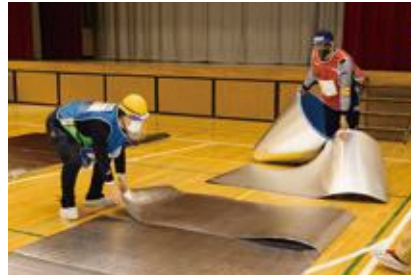
【一般避難居室の設営】