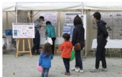
【防災展示・体験コーナー】

防災拠点訓練終了後、防災展示・体験コーナーの見学やかまどベンチによる炊き出しの試食などを行いました。