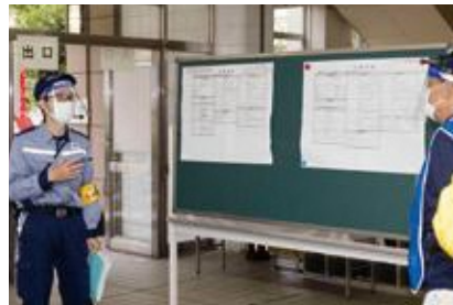
【被害状況などの情報掲示】