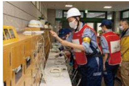
【特設公衆電話の設置】