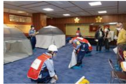
【感染者等専用居室の設営】