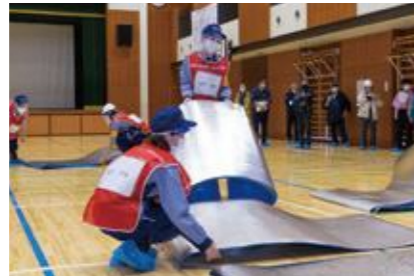
【一般避難居室の設営】