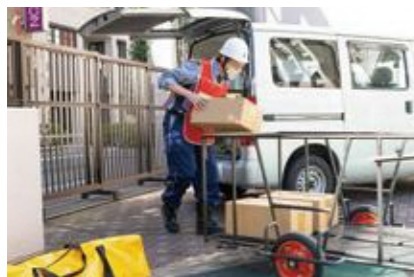
【救援物資の受け入れ】