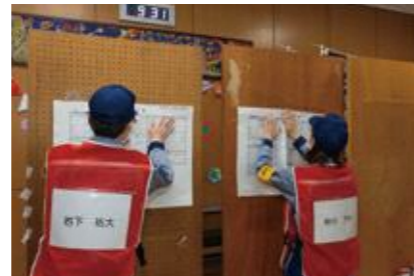
【被害状況などの情報掲示】