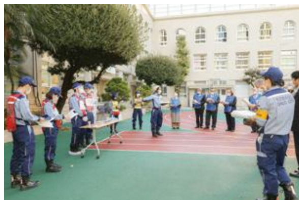
【感染症マニュアルの確認】

令和2年度に中央区が作成した「感染症対策基本マニュアル」を基に、感染症対策を踏まえた避難所運営訓練を行いました。