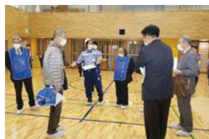
【体育館（一般避難居室）】

常盤小学校の改修を見据えて、災害時施設利用計画の変更（小学校別館部分を新たに避難居室として利用）について、検証を行いました。