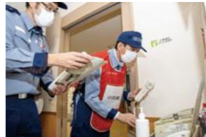
【無線通信訓練の実施】