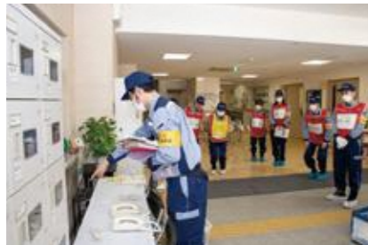
【特設公衆電話の設置】