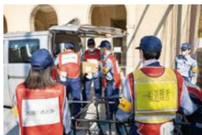
【救援物資の受け入れ】