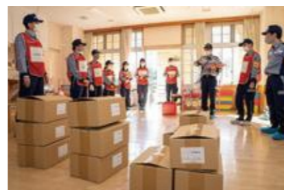
【救援物資の仕分け】