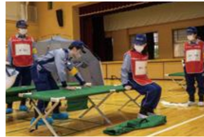
【要配慮者優先居室の設営】