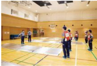
【一般避難居室の設営】