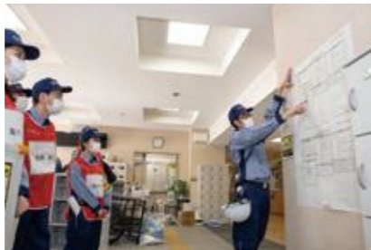
【被害状況などの情報掲示】