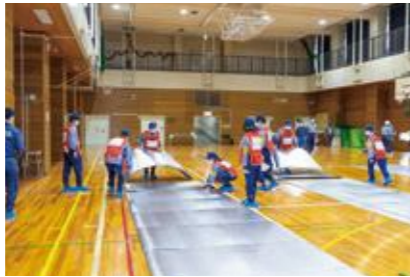
【一般避難居室の設営】