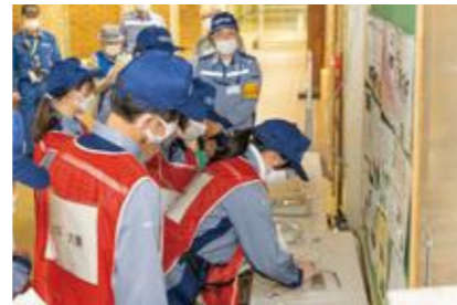
【特設公衆電話の設置】