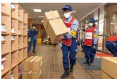
【救援物資の仕分け】