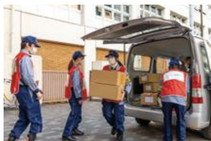
【救援物資の受け入れ】