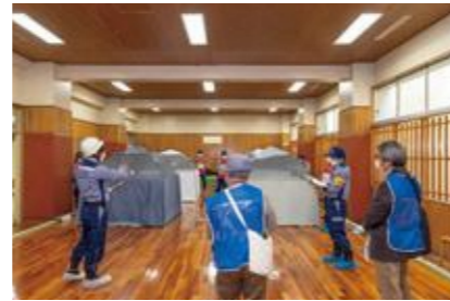
【感染者等専用居室の設営】