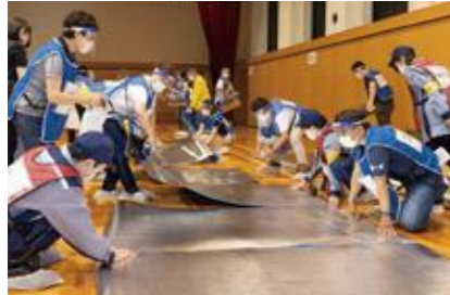
【一般避難居室の設営】