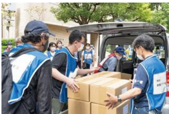
【救援物資の受け入れ】