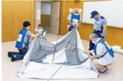
【要配慮者等優先居室の設営】