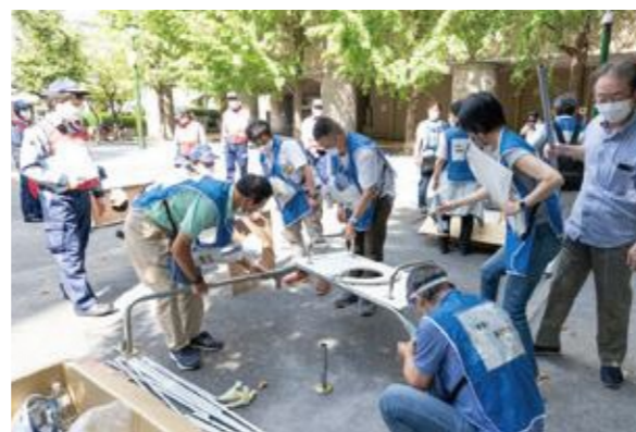
【マンホールトイレの設置】