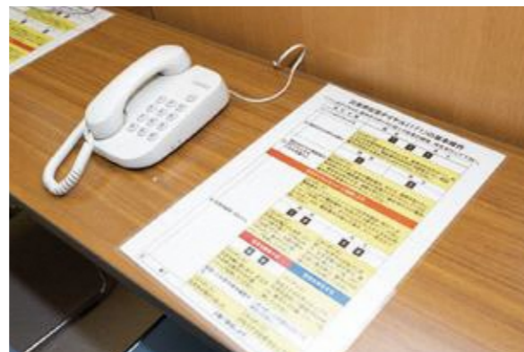
【特設公衆電話の確認】