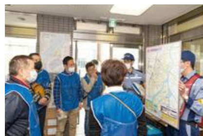
【一時滞在施設マップの確認】