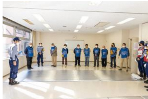
【一般避難居室設営の確認】