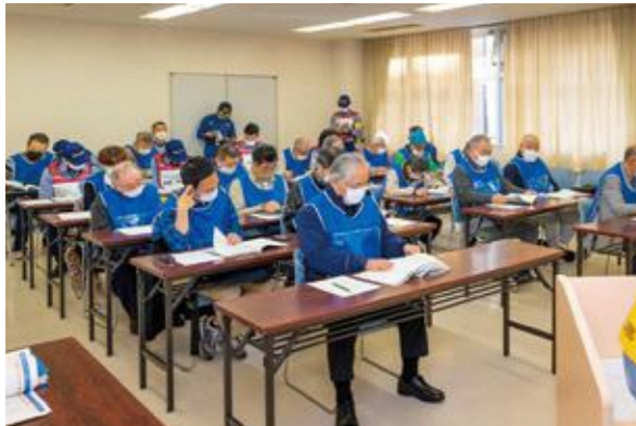
【感染症マニュアルの確認】