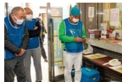
【特設公衆電話の確認】