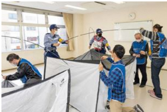
【要配慮者等優先居室の設営】