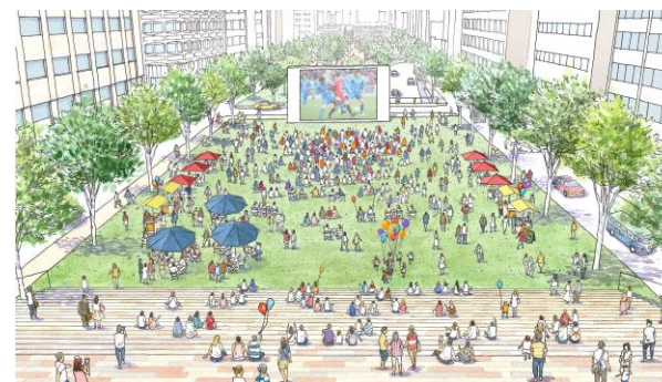
誰もが体験・交流・発信できるパブリックスペース (築地川アメニティ整備構想)