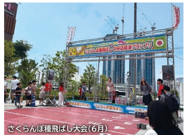
さくらんぼ種飛ばし大会(6月)