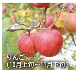
りんご (10月上旬～11月下旬)