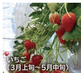
いちご (3月上旬～5月中旬)