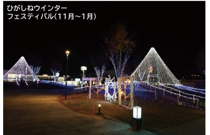
ひがしねウインター フェスティバル(11月〜1月)