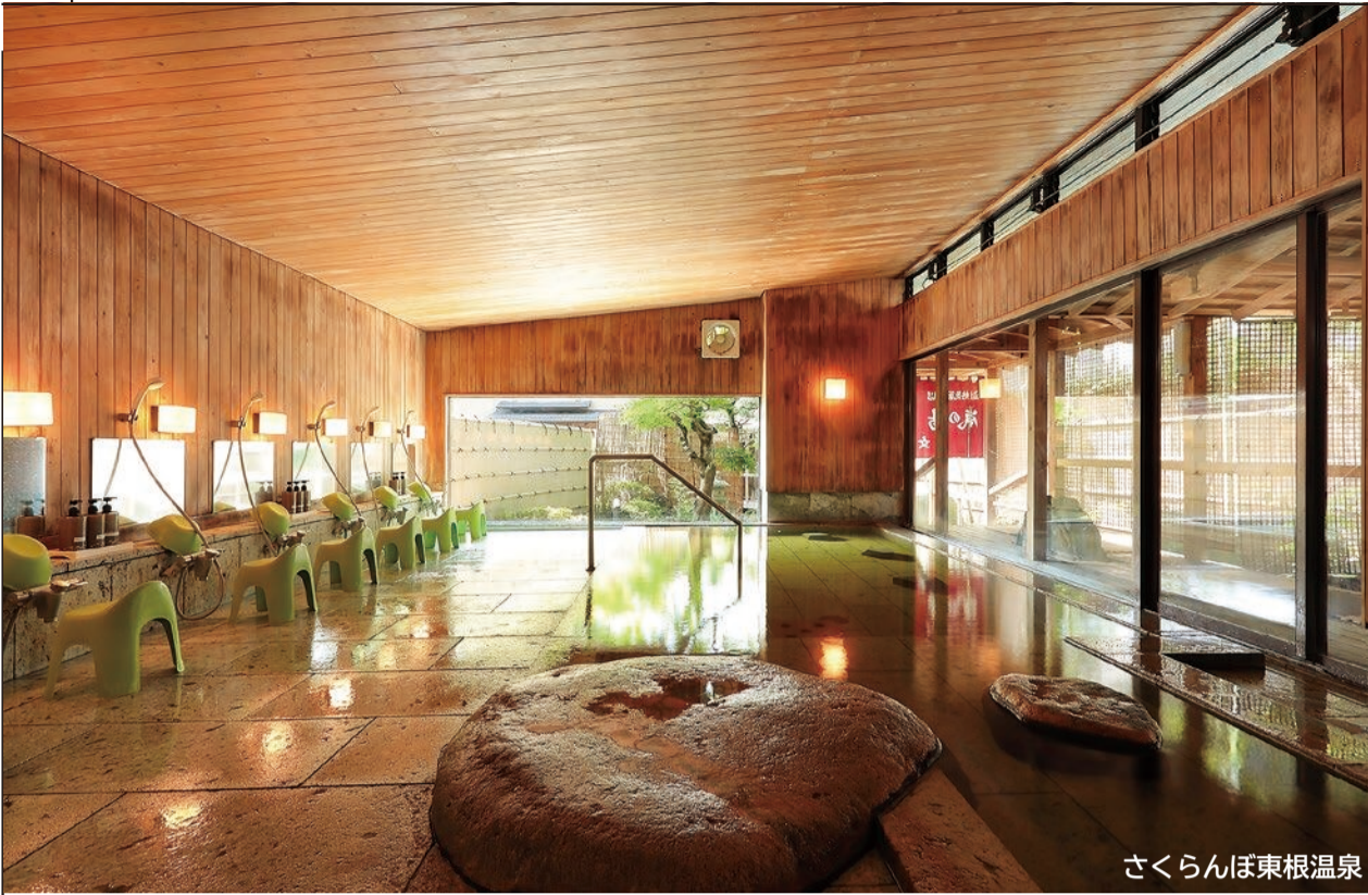
さくらんぼ東根温泉