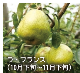
ラ・フランス (10月下旬～11月下旬)