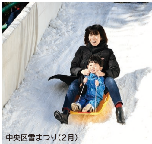
中央区雪まつり(2月)