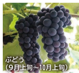
ぶどう (9月上旬～10月上旬)