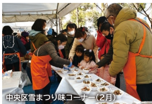
中央区雪まつり味コーナー(2月)