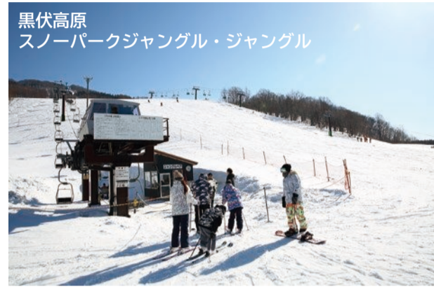
黒伏高原 スノーパークジャングル・ジャングル