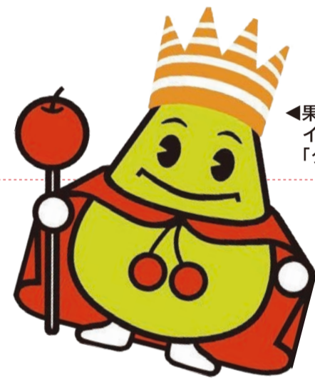
果樹王国ひがしね イメージキャラクター 「タントくん」