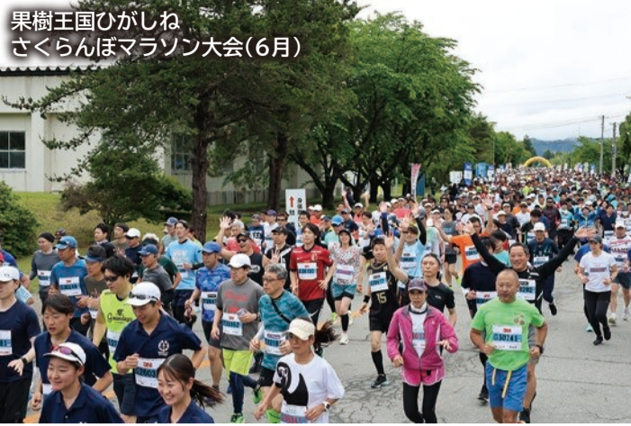
果樹王国ひがしね さくらんぼマラソン大会(6月)