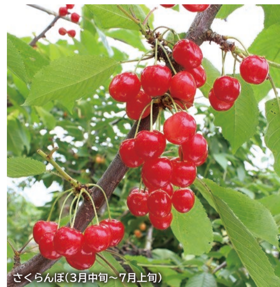
さくらんぼ(3月中旬～7月上旬)