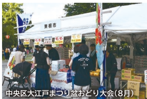
中央区大江戸まつり盆おどり大会(8月)