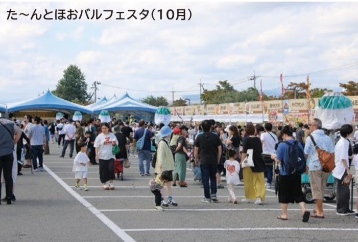
た〜んとほおバルフェスタ(10月)