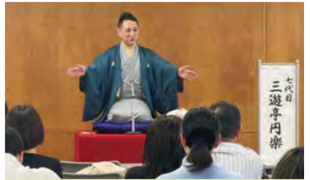
七代目三遊亭円楽師匠

落語家の家族と子育てや、師弟関係を通して、親から子へ繋ぎ、受け取ったものを次の世代へ受け継ぐ大切さなど、講師の体験に基づいた貴重なお話を伺うことができ、家庭教育を考える大変良い機会となりました。