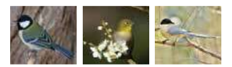
シジュウカラ メジロ オナガ