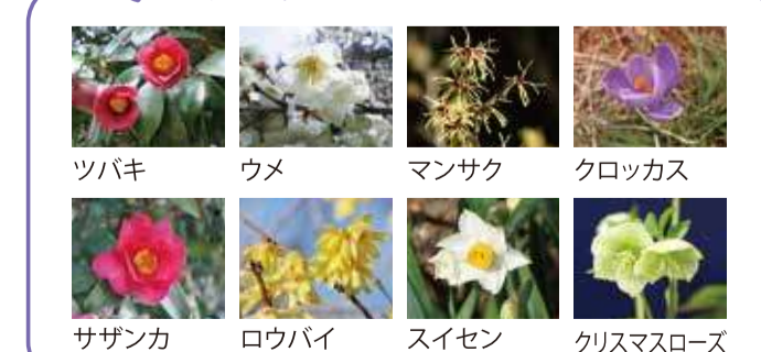
ツバキ ウメ マンサク クロッカス サザンカ ローバイ スイセン クリスマスローズ