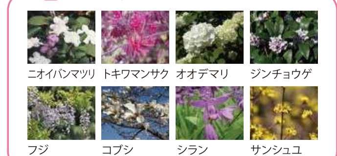
ニオイハナツリ トキワマンサク オオデマリ ジンチョウゲ フジ コブシ シラン サンシュユ