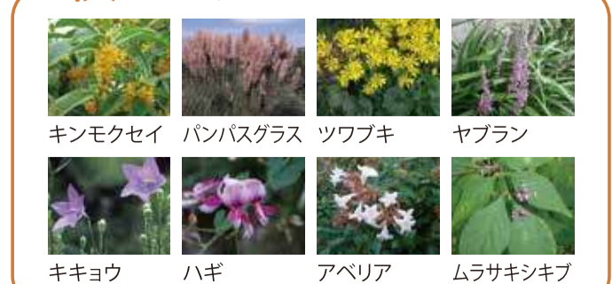
キンモクセイ パンパスグラス ツツキ ヤブラン キキョウ ハギ アペリア ムラサキシキブ