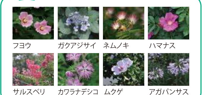
フヨウ ガクアザミ ネムノキ ハマナス サルズベリ カワラナデシコ ムクゲ アガパンサス