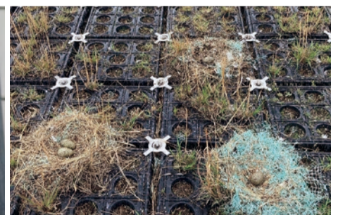
▲ウミネコの巣・卵