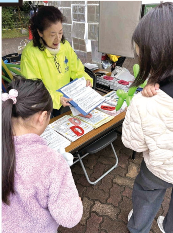
▲健康福祉まつりでの活動の様子

区内在住・在勤者をはじめ、開業獣医師や動物愛護団体、動物関係業者などの方々の中から区が委嘱しており、現在45人が活動しています。