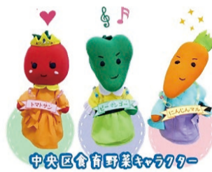
中央区食育野菜キャラクター