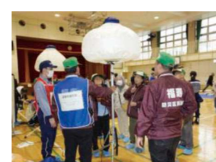
防災資器材操作訓練