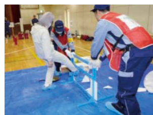
ベランダ蹴破り訓練