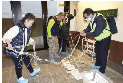
特設公衆電話設置訓練