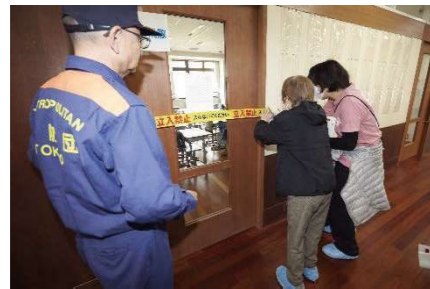
施設安全点検訓練