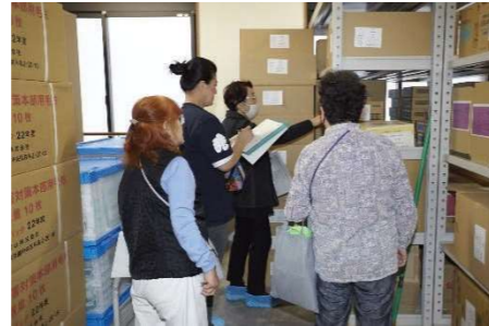
防災倉庫確認訓練