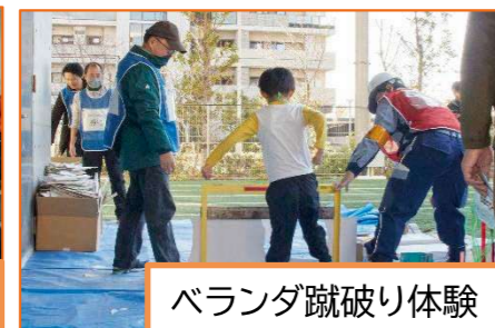
ベランダ蹴破り体験