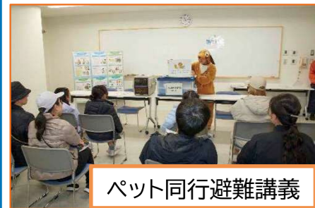
ペット同行避難講義