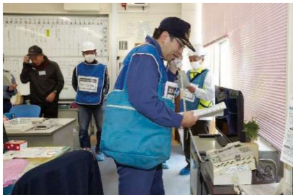
地域防災無線・校内放送訓練