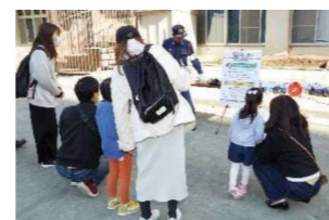
防災クイズラリー