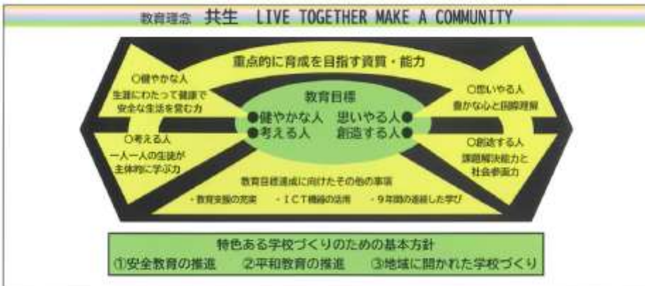
【晴海中学校の教育理念・教育目標】