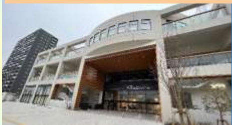
HARUMIRAI(晴海地区交流中心)