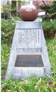
平和モニュメント