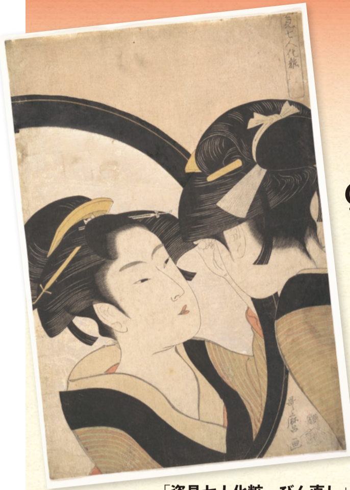
「姿見七人化粧・びん直し」