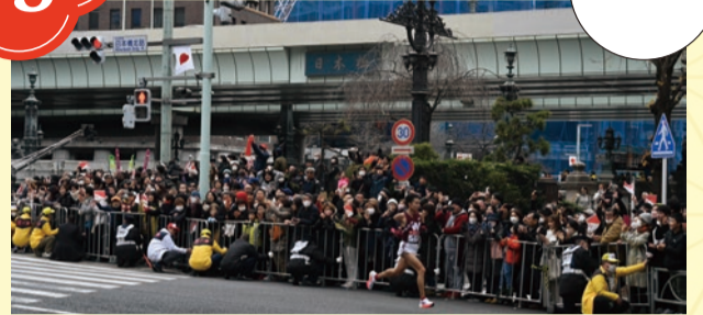
3日の復路で中央通り(京橋~日本橋北詰間)を駆け抜けます。