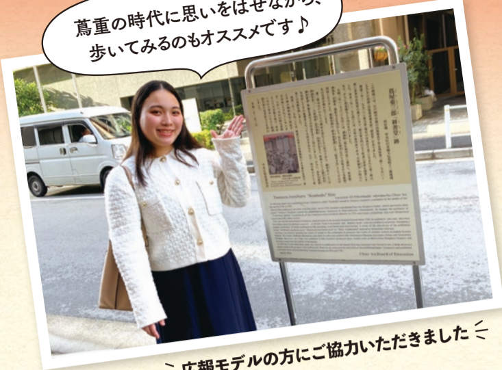
広報モデルの方にご協力いただきました