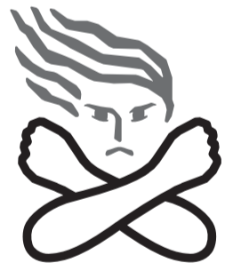
女性に対する暴力根絶のためのシンボルマーク

いじめや差別など人権問題でお困りの方は、ぜひご相談ください。 日 毎月第3木曜日 午後1時～4時 場 区役所1階区民相談室 問 まごころステーション ☎(3546)9590