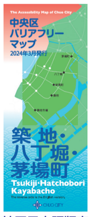
▲地図日本語版表紙

中央区バリアフリーマップ(築地・八丁堀・茅場町)の発行 NPO法人リーブ・ウィズ・ドリームと協働し、区内のバリアフリーマップを作成しています。 地図は、日本語版と英語版があり、区役所地下1階地域福祉課、日本橋・月島・晴海特別出張所などで配布している他、HPからご覧いただけます。