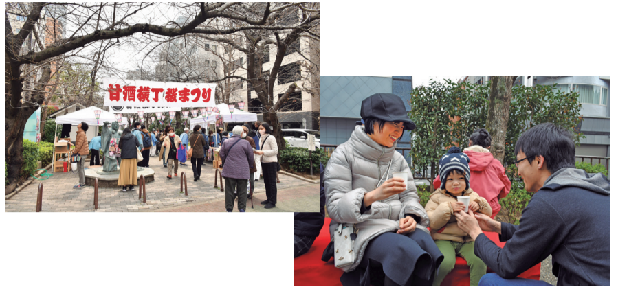
甘酒横丁 桜まつり

3月24日、浜町川緑道(弁慶像横)で「甘酒横丁 桜まつり」が開催されました。会場では、約2,000杯の甘酒が無料で振る舞われた他、甘酒横丁商店街のお店の名産品や加盟店の食事券が当たる抽選会が行われました。例年よりも桜の開花が遅い中での開催となりましたが、来場された方々は甘酒を楽しみ、当たりくじを引けるようにと抽選箱に手を伸ばすなど、大いに盛り上がりを見せた一日となりました。