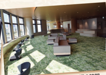
温暖浴スペースでくつろぐ至福の時間