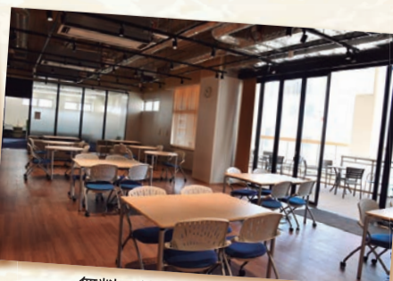
無料で使える学習スペース