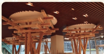
▲メモリアルスペースには東京2020大会のピレージプラザで使用された木材を活用したオブジェがあります。

東京2020大会終了後から整備工事を進めてきた晴海西小学校・晴海西中学校の新校舎が完成しました。新しいまちの学び舎が開校し、4月8日からは子どもたちを迎えます。これに伴い区立小学校は17校、区立中学校は5校となりました。詳しくはHPをご覧ください。