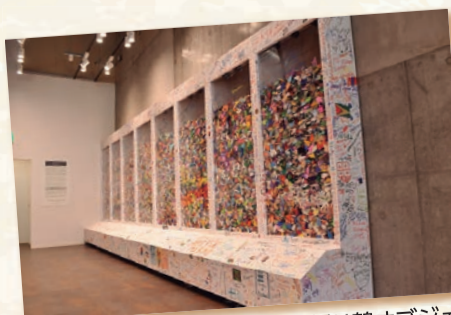
東京2020大会のレガシーの折り鶴オブジェがお出迎え