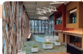
▲館内の様子 木材に近づいてみると...

開館は、7月1日を予定しています。詳しい情報は区のおしらせの他、HPでも発信していきます。