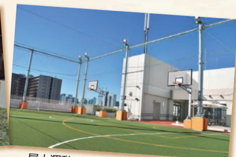
屋上運動スタジオで体を動かそう!