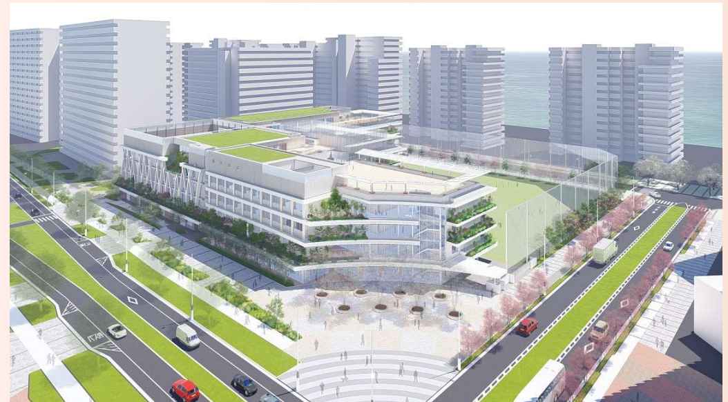
晴海西小学校・晴海西中学校（イメージパース）