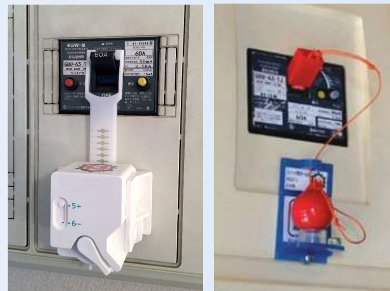
感震ブレーカー簡易型(例)