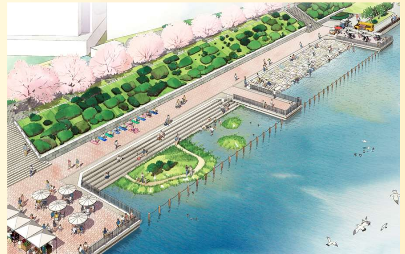
水辺活用のイメージ