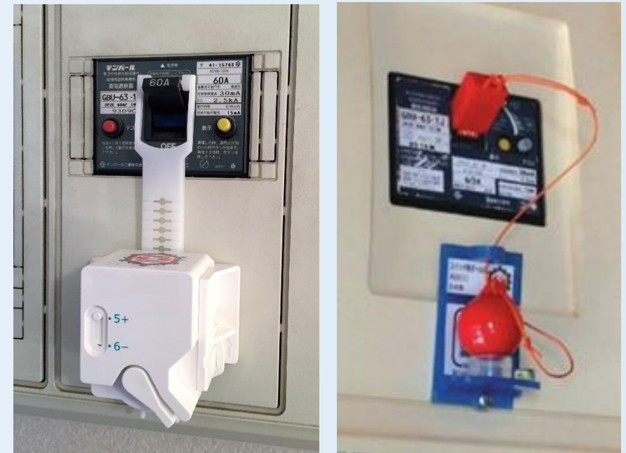
感震ブレーカー簡易型(例)