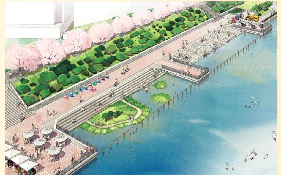
水辺活用のイメージ