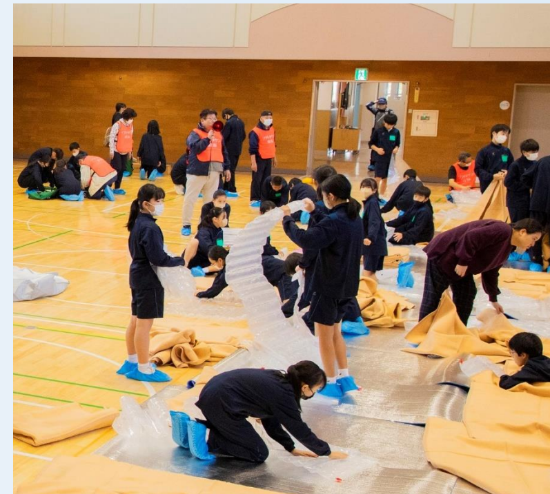
防災拠点運営委員会訓練

災害時における防災区民組織等の情報収集・伝達力を強化するため、Wi-Fi環境整備・発電機の購入費用の補助や発電機の供与を実施