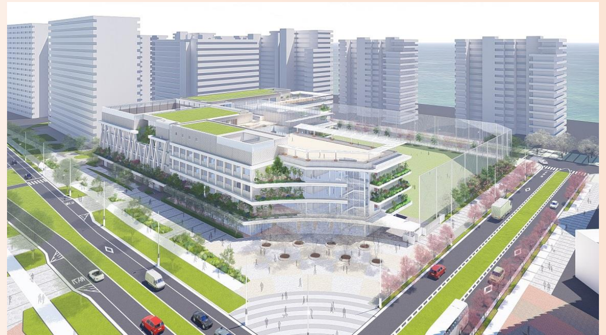
晴海西小学校・晴海西中学校（イメージパース）