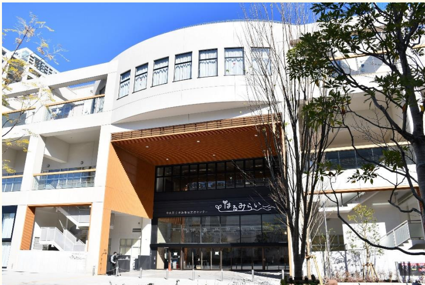
晴海地域交流センター「はるみらい」