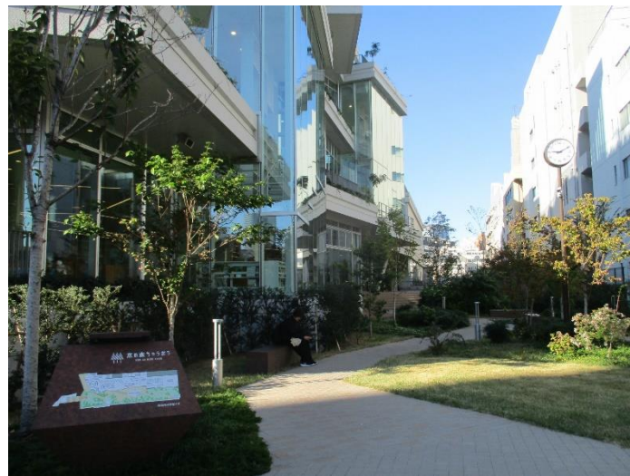
本の森ちゅうおう