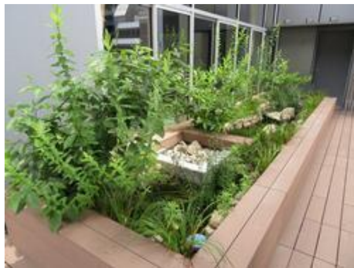
城東小学校（複合施設共用部）