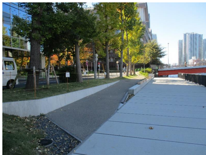
朝潮運河親水公園(晴海五丁目東側)の拡張