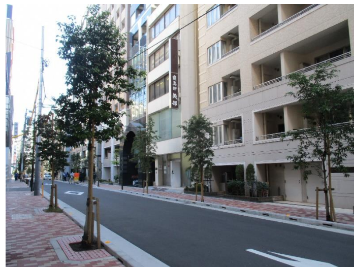
日本橋大伝馬町17先 常緑ヤマボウシ24本