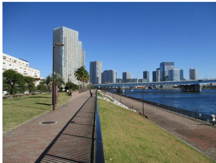
<参考>晴海緑道公園（東京都 海上公園）