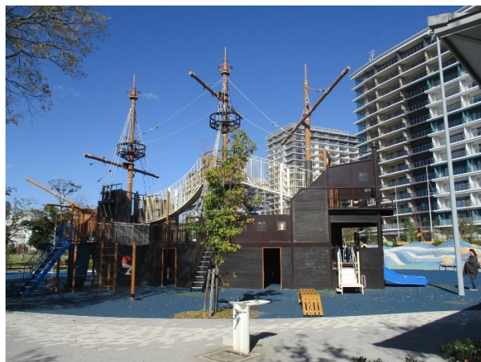
<参考>晴海ふ頭公園（東京都・海上公園）