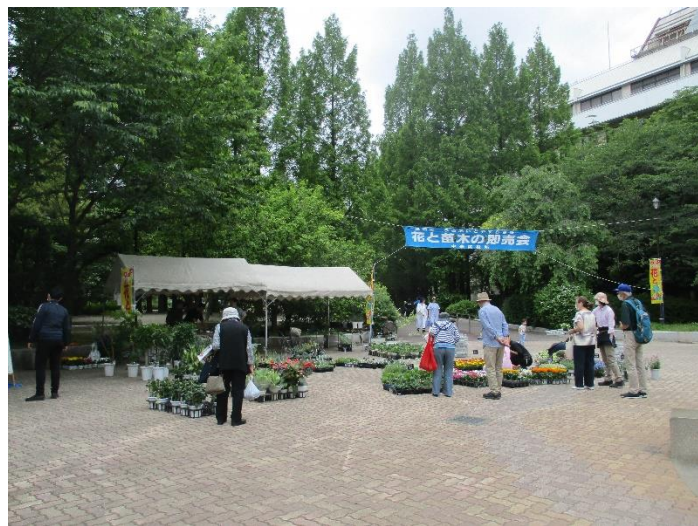
花と苗木の即売会