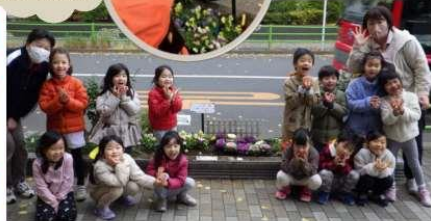
植付け前に、雑草を抜くこと、土を柔らかくすること、根が大事だと教えてもらいました。