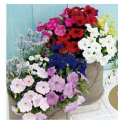
小さめに花がらを摘んでたくさん花を咲かせましょう