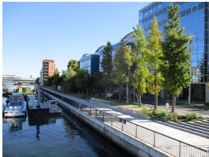
朝潮運河親水公園(晴海五丁目東側)の拡張

施策1-1-(1)公園等の整備拡充 施策1-6-(1)施設のバリアフリー化 施策1-6-(2)多言語・ピクトグラム表記を用いた看板などの設置