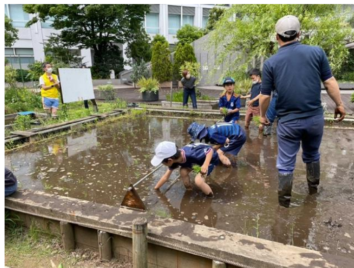
田植えイベント(晴海第三公園)