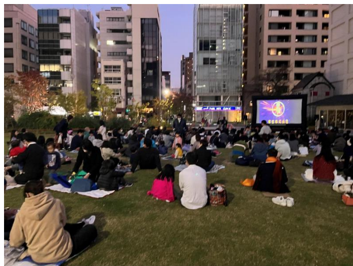
茅場町商店会主催ナイトシネマ (坂本町公園)