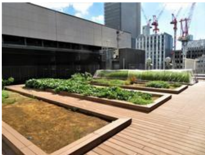
城東小学校（複合施設共用部）