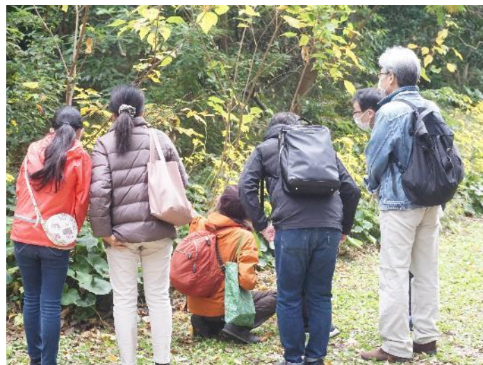
区立環境情報センター開催講座