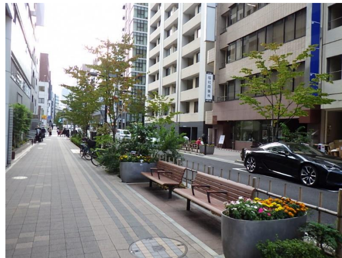
日本橋本町2-6先 ヤマボウシ35本他