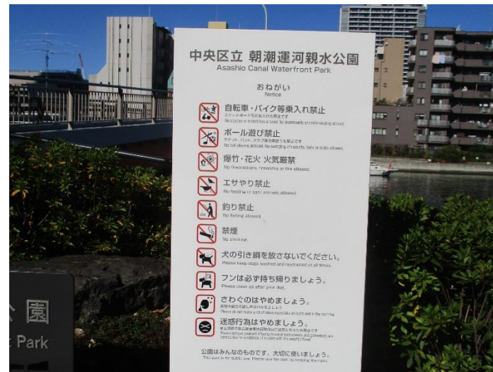
朝潮運河親水公園(晴海五丁目東側)の拡張