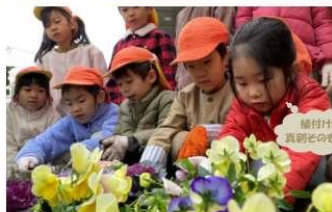
植付けは真朝ちゃんの！

今回のゆり組の子供たちにとっては、数回の植付けにも関わらず、植付け方法を覚えていて、まだ小さい子供でも過去の学びが身に付いていて、感心の植付け会でした。