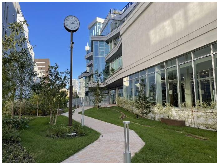
本の森ちゅうおう