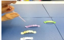
【お口あそびの様子】