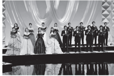
▲杜の音シンガーズ