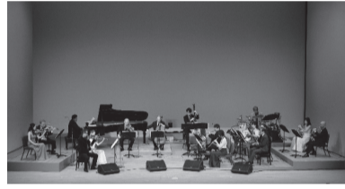
▲N響団友ポップスオーケストラ