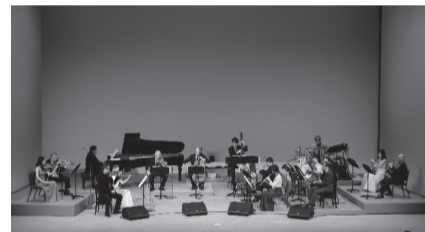
▲N響団友ポップスオーケストラ