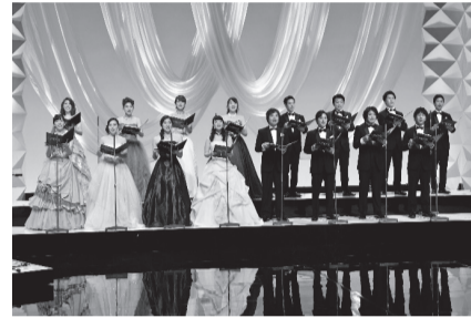
▲杜の音シンガーズ