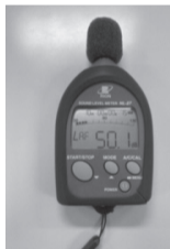
▲貸し出している騒音計