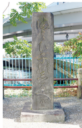
一石橋迷子しらせ石標

また、願書によれば、たづぬる方には迷子の親が「迷子の詳細(名前・年頃・面体・格好・衣類・家主の名前・町名)」を記した紙を貼り置き、しらする方には迷子を留め置く町内から「町名・迷子の名