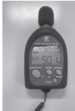
▲貸し出している騒音計

近所への騒音が心配な方に騒音計を貸し出しています。 対 区内在住者、区内に事業所がある方 [貸し出し台数] 1回1台 [期間] 1週間以内 申 電話で区へ。 問 環境課生活環境係 ☎(3546)5404