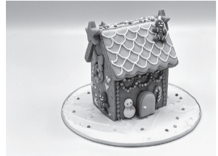
▲お菓子の家(直径13.5cm×高さ10cmのケースに入る程度)