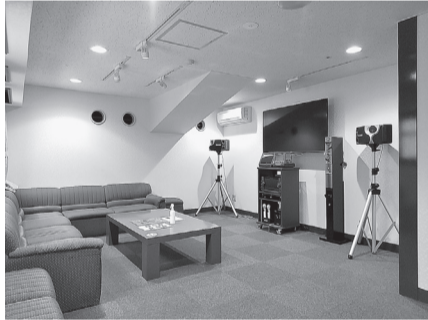
▲オーディオルーム

7月1日からオーディオルームのカラオケ機器が新しくなりました。ご家族、ご友人などとお楽しみください(利用料金:1曲100円)。