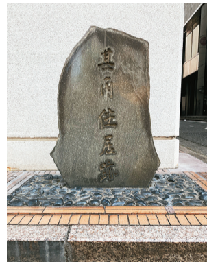
「其角居住跡」の刻銘碑 (日本橋茅場町一丁目6番10号)

江戸時代後期の地誌「江戸名所図会」には、其角の居住地に関して「俳仙宝晋齋其角翁宿 茅場町薬師堂の辺也といひ伝ふ元禄の末ころに住す即終焉の地なり」という記述とともに、近隣にあった儒学者・荻生徂徠(1666~1728)の居宅を詠んだ句「梅が香や隣は荻生惣右衛門(里俗の口碑)も記されています。また、弟子が編さんした其角の遺稿「類柑子」に「北の窓」にも、「我栖北隣に芦荻茂く生て笹阿なる地あり茅場町といふ名にふれて昔は海辺なりしを今は榮行家作りして山王権現の御旅所と定め薬師佛立給ふに堂のかみ斗ただ