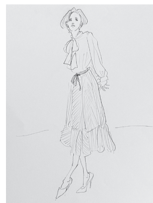
鉛筆クロッキーサンプル