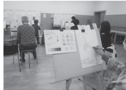
鉛筆クロッキー講座風景