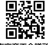
▲東京商工会議所 イベント・セミナー