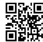
◀東京しごとセンター 女性しごと応援テラス

凡例 日日時 会場 対象 内容 講師 定員 費用・料金(記載がない場合は無料) 申し込み方法 託児 問い合わせ先(申込先) HP ホームページ Eメールアドレス