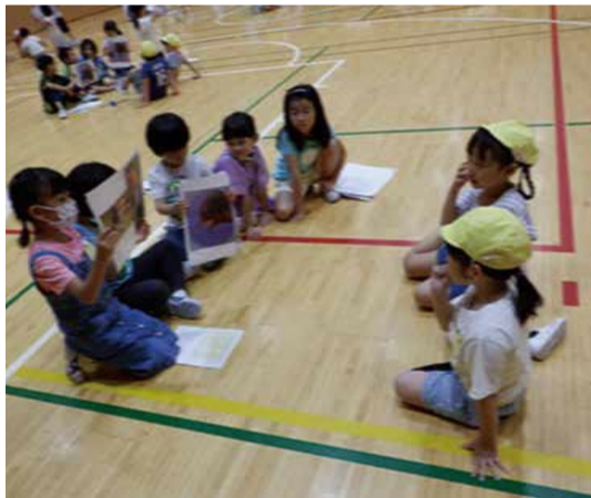
1年生の「くちばしクイズ」

後半には、園児が明石音頭を披露し、最後は児童や海外から来たお客様も含め、全員で明石音頭を踊り一体感を感じることができました。