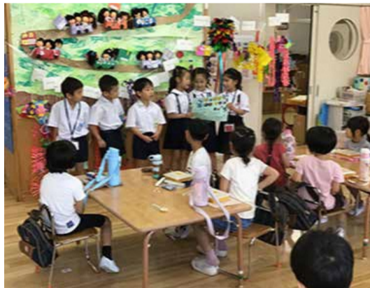
「しゃぼんだまランド」への招待

7月5日(水)久松小学校1年生児童が、久松幼稚園の年長児を「しゃぼんだまランド」に招待しました。児童は、これまで、生活科でしゃぼんだまについて学習してきた内容を踏まえ、遊ぶための道具を園児と一緒に作ったり、膨らませ方の見本を示したりしながら交流をしました。交流の中で児童は園児に目線を合わせたり、優しい口調で声をかけ、園児は安心して関わりを楽しんでいました。大きく膨らんだことを一緒に喜ぶ姿、しゃぼんだまと一緒に追いかける姿がたくさん見られ、次の交流への期待につながる活動となりました。