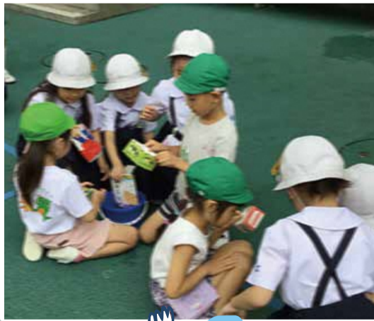
しゃぼんだまづくり

幼児期の教育と小学校教育の円滑な接続を図るため、区立幼稚園と小学校では計画的に交流活動を行っています。交流活動を通して、園児には小学生への憧れや小学校生活への期待感が育まれ、小学生は思いやりの気持ちを抱き、自分の成長に気付く機会にもなります。今回は7月に実施した、2つの交流活動を紹介します。