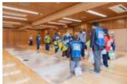
【避難居室設営訓練】