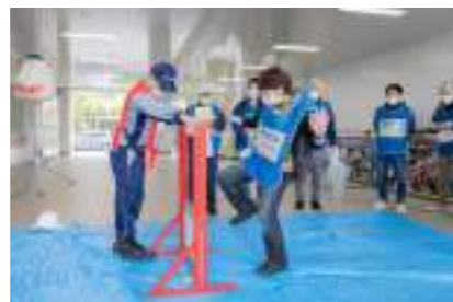
【ベランダ避難体験訓練】