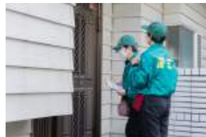
【要配慮者安否確認訓練】