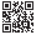
東京しごとセンター

◎参加企業は8社程度です。求人情報は開催日の2週間前までにシルバーワーク中央および東京しごとセンターのHPに公開します。