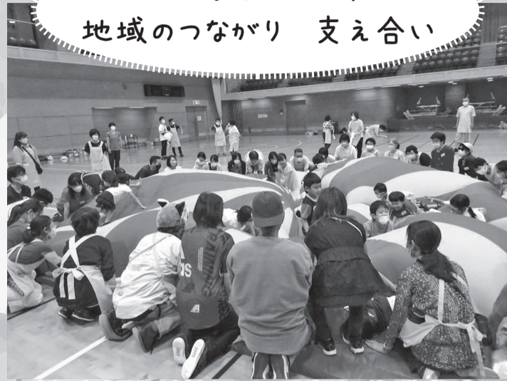
▲令和4年度子育て支援イベント～子どもと一緒に遊ぼうデー～の様子

凡例 ※費用の記載がないものは無料 ☎お問い合わせ(申込先)HPホームページEメールアドレス