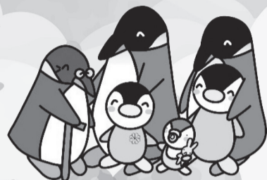
ミンジー (民生児童委員イメージキャラクター)