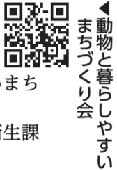
動物と暮らしやすいまちづくり会

日 6月3日(土) 午後1時30分～3時 場 浜町公園内 わんわん広場 対 区内在住で、次のいずれかの方 ①犬を飼っている方(犬の登録および狂犬病の予防注射済票の交付手続きを済ませていること) ◎飼い主がマイクロチップ情報を環境省のデータベースに登録することで犬の登録は完了します。 ②犬を飼う予定のある方 内 ・基本的な犬のしつけ方や飼い主のマナー、災害時の備えの講義・意見交換、質疑応答 定 20人(先着順/1回の申し込みにつき1人、犬1頭まで) 申 5月8日～26日に電話で問へ [主催] 中央区 [運営] 動物と暮らしやすいまちづくり会 問 中央区保健所生活衛生課 生活衛生係 ☎(3541)5936