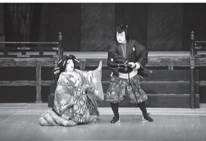
▲昨年の古典芸能鑑賞会 舞踊 「常磐津 忍夜恋曲者-将門-」

問〒104-0041 中央区新富1-13-14 中央区文化・国際交流振興協会 ☎(3297)0251