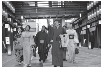
▲プライベート街歩きツアー(イメージ)

また、当サイトでは「プライベート街歩きガイドツアー」もお申し込みできますので、併せてご利用ください。