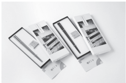
▲漆塗筆・箸置セット/黒江屋